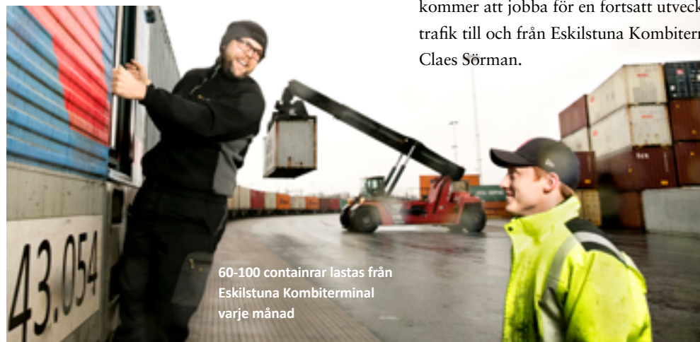
60-100 containrar lastas från Eskilstuna Kombiterminal varje månad